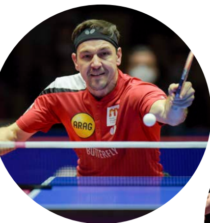
Timo Boll

Aktuelle Informationen zum InCHECK'D und zur Patenschaft von Borussia Düsseldorf unter: www.duesseldorf.de/check-d